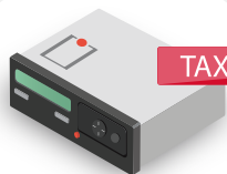
ТАХОГРАФ VDO DTСO 3283

с 2014 года имеет свидетельство об утверждении типа средства измерения